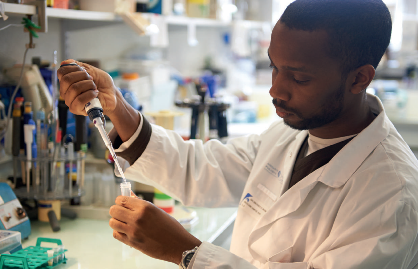
Étudiant en master Inflammation et maladies inflammatoires