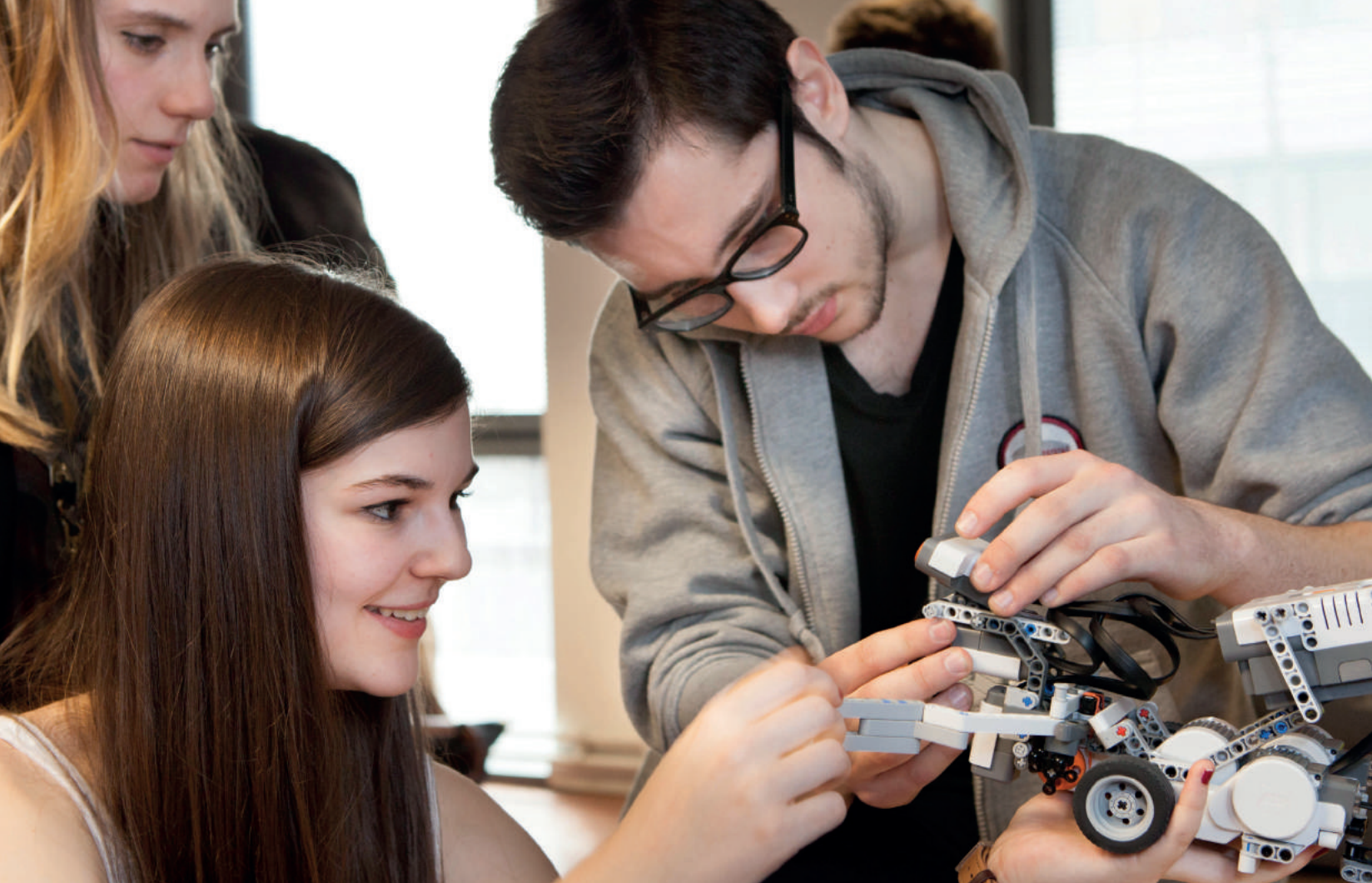
Élèves de l'École d'Ingénieur Denis Diderot