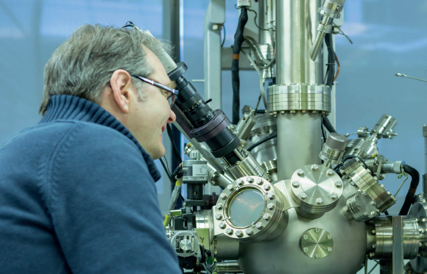
Spectroscopie de Photoélectrons X (XPS) au laboratoire Itodys